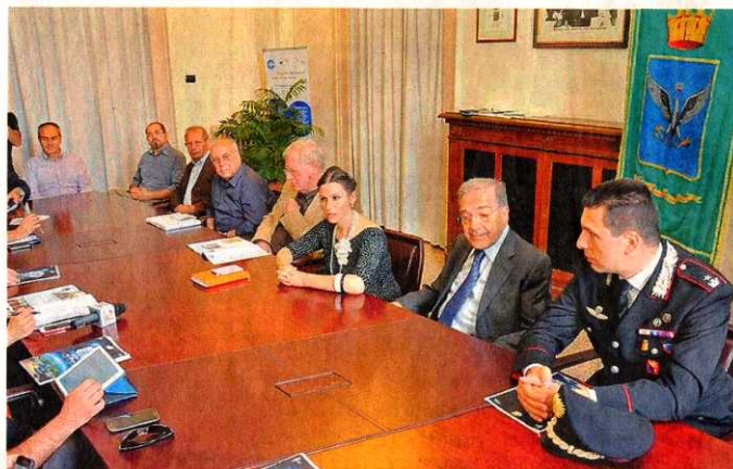
UN MOMENTO DELLA CONFERENZA STAMPA PER IL VENTENNALE DEL PREMIO RAGUSANI NEL MONDO