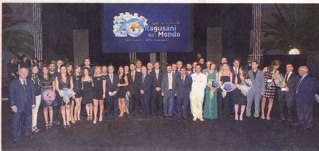
Foto di gruppo sul palco di piazza Libertà per i premiati della ventesima edizione del Premio Ragusani nel Mondo

Ragusani nel Mondo. Il bilancio della ventesima edizione del premio