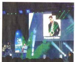
L'ESIBIZIONE DEL SASSOFONISTA FRANCESCO CAFISO