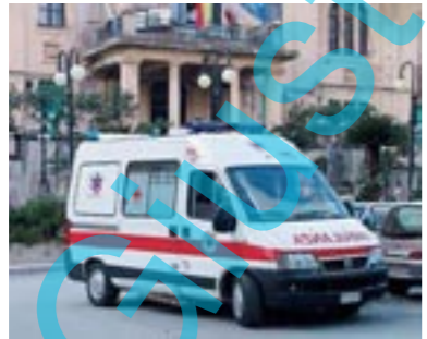
L'autista-soccorritore viene eliminato nella nostra città

/soccorritore ambulanza in pro- 12 di Modi- , in verità, are domani, daccali, sarà qualche serietà di ren- sa la gestio-