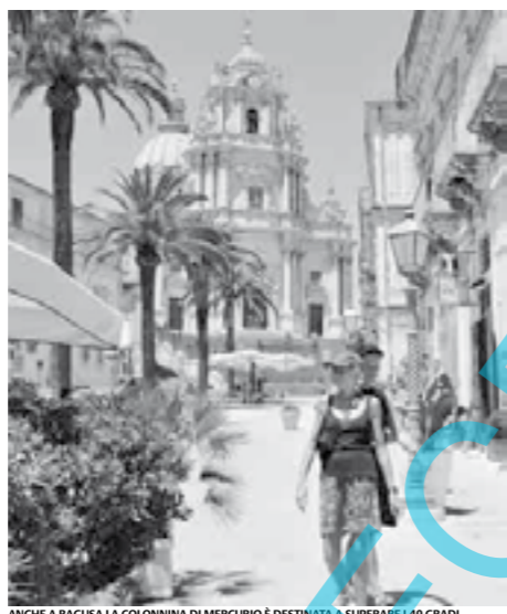
ANCHE A RAGUSA LA COLONNINA DI MERCURIO È DESTINATA A SUPERARE I 40 GRADI

Le temperature si sono innalzate già da ieri, e l'afa ci farà compagnia sino alla prossima settimana