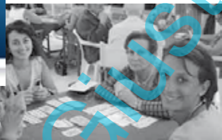
Uno dei tavoli dei partecipanti al torneo di buracco organizzato dal Soroptimist club ibleo per una raccolta di fondi finalizzata all'acquisto di attrezzature per la palestra femminile del carcere contrada Pendente

Ragusa. Organizzato dal Soroptimist un torneo di beneficenza