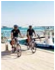
Agenti in bici nel porto di Marina

C'è un ordigno bellico nello specchio d'acqua tra Donnaluca e Marina. Lo ha scoperto il personale della squadra nautica della Polizia, che lo ha individuato a duecento metri dalla costa. I poliziotti del mare hanno evidenziato la presenza dell'ordigno utilizzando l'eco scandaglio e da strumentazione che hanno a bordo del proprio natante. L'ordigno si troverebbe ad una profondità di cinque metri e risalirebbe al secondo conflitto mondiale.