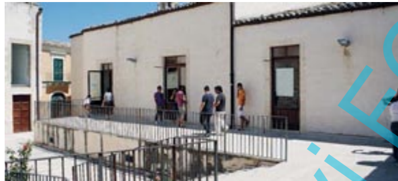
La presenza della facoltà di Lingue in città continua ad essere a rischio: adesso la Cgil invoca un tavolo per trovare soluzioni

per la pre- n città. Do- Provincia di e il proprio il Consorzio la transa- di Catania ischio. Per- ossa quota, e a ricadere ine, che più uò garanti-