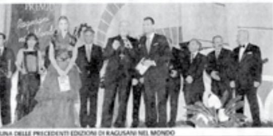
UNA DELLE PRECEDENTI EDIZIONI DI RAGUSANI NEL MONDO