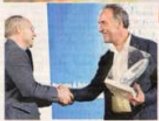
Premio speciale al fotografo Tony Gentile, autore della celebre foto dei giudici Falcone e Borsellino sorridenti. Sopra, Orietta Berti

Una serata di grande spettacolo, con artisti di chiara fama nel panorama siciliano e nazionale e la suggestiva, e ormai tradizionale, location di piazza Libertà, per un omaggio alla ragusità nel mondo. Musica, impegno e tanto divertimento per la 24esima edizione del Premio Ragusani nel Mondo, andato in archivio sabato sera. Un'edizione speciale, che anticipa il 25esimo anniversario che cadrà il prossimo anno, che si è conclusa con un'importante notizia che riguarda il mondo della cultura e dello spettacolo. Ad annunciare è stato il maestro Giovanni Cultrera, direttore artistico di Ibla Classica Internazionale e 89 anni fa tra i premiati. La prossima edizione della manifestazione sarà infatti caratterizzata da un evento straordinario: la presenza dell'intera orchestra del Teatro San Carlo di Napoli. Un'intesa che è stata raggiunta grazie anche al sovrintendente Rosanna Parriccia, e grazie soprattutto all'appoggio del Comune di Chiaramonte Gulfi, il primo a credere a questo accordo, e al Comune di Ragusa, città in cui si svolgeranno i concerti il prossimo anno (1 e 2 agosto). Sarà dunque un evento nell'evento che servirà a celebrare il quarto di secolo raggiunto dal premio che continua ad abbracciare tutti i ragusani sparsi nel mondo esaltando, di anno in anno, storie d'eccezione.