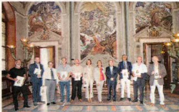
I PREMIATI DEL 24° RAGUSANI NEL MONDO NEI SALONI DELLA PREFETTURA.