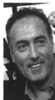
Tony Gentile, comisano di nascita e palermitano d'adozione, è l'autore della celebre foto di Falcone e Borsellino sorridenti.

Tony Gentile sarà dunque uno dei nove premiati del premio "Ragusani nel Mondo" che sarà trasmesso anche in diretta sulla pagina facebook e che nel corso della serata vedrà tante sorprese a partire dal cast artistico, guidato dall'ospite d'onore Orietta Berti.